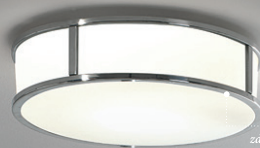
zdj. 01 - oświetlenie sufitowe np. MASHIKO ROUND

Jeśli budżet jest ograniczony, a chcemy zachować rozwiązanie oświetlenia centralnego, można użyć natynkowych reflektorów ( zdj. 03 ). Każdy z potrójnych reflektorów może być indywidualnie skierowany na trzy różne punkty w pomieszczeniu, co daje strumienie światła dokładnie tam, gdzie są potrzebne i przy okazji stwarza ciekawą „scenę” oświetlenia.