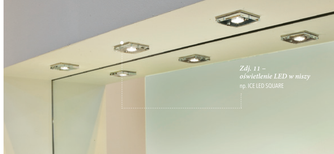
Zdj. 11 – oświetlenie LED w niszy np. ICE LED SQUARE

Oprawy LED na wysokości listwy (zdz. 13) są idealne do oświetlenia ściany tuż przy podłodze. Odpowiednie ustawienie świateł powoduje delikatny blask oraz wrażenie unoszenia się ściany w powietrzu.