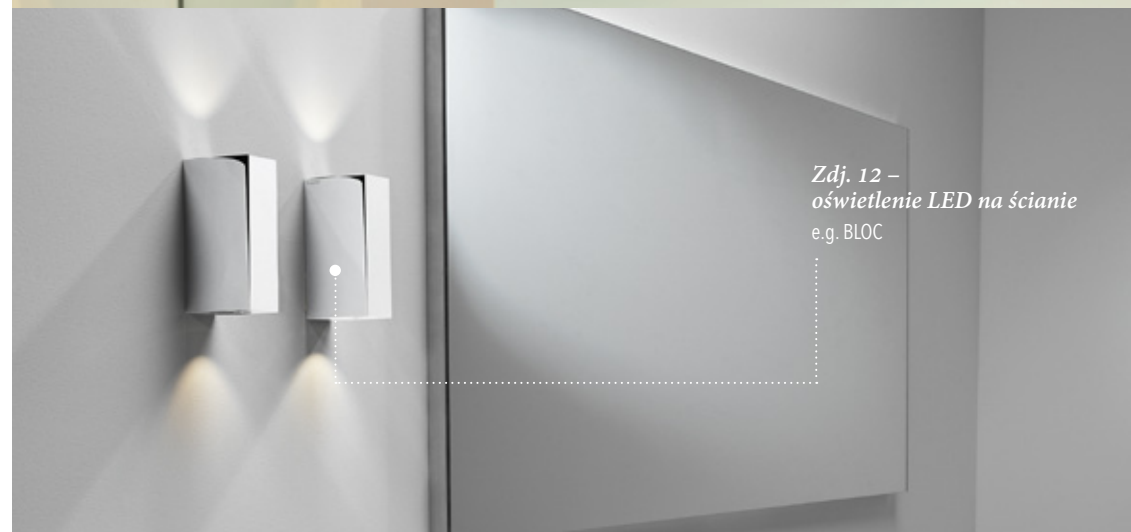
Zdj. 12 – oświetlenie LED na ścianie e.g. BLOC