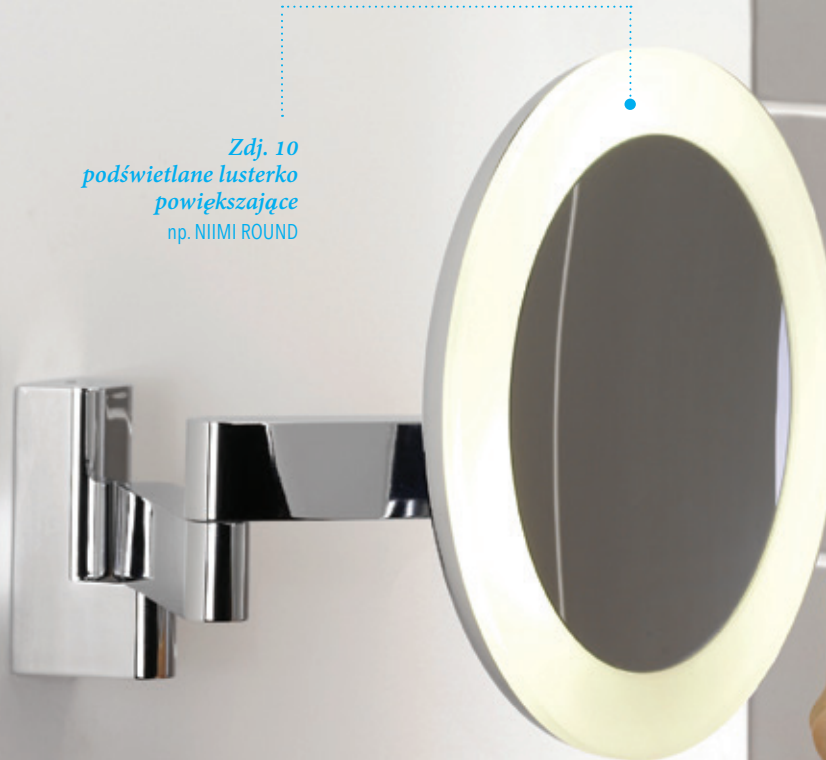
Zdj. 10 podświetlane lustro powiększające np. NIIMI ROUND