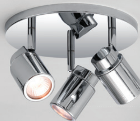
fig. 03 - oświetlenie punktowe np. COMO TRIPLE ROUND