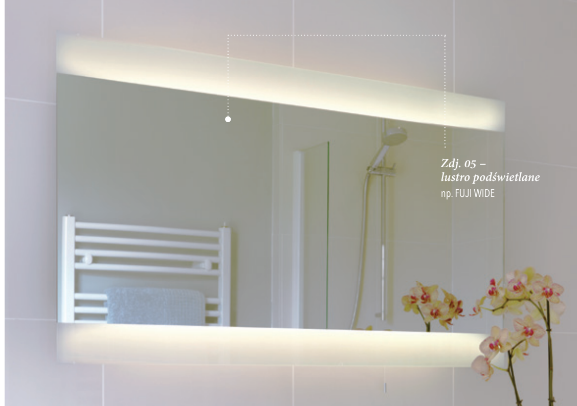
Zdj. 05 – lustro podświetlane np. FUJI WIDE