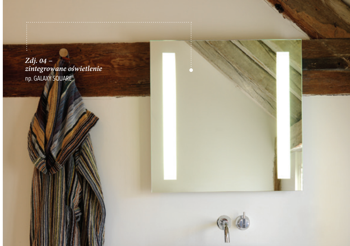
Zdj. 04 – zintegrowane oświetlenie np. GALAXY SQUARE

Są w ofercie Astro Lighting takie lustra, które dają także subtelny efekt oświetlenia ściany za lustrem. Sprawia to wrażenie jakby lustro się unosiło - np. Fuji Wide ( zdj. 05 ).