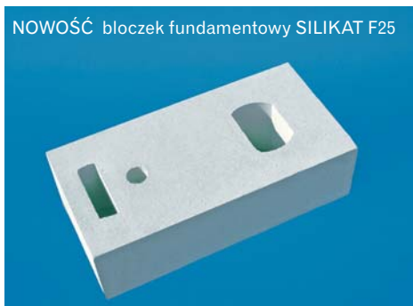
NOWOŚĆ bloczek fundamentowy SILIKAT F25

potwierdzona tradycją i stosownymi badaniami. Oczywiście tak jak w przypadku bloczków betonowych trzeba je zabezpieczyć odpowiednią izolacją w zależności od warunków grunto-wodnych.