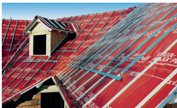
Folia Delta®-Maxx Plus