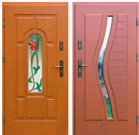
Cena brutto 2830 zł + witraż