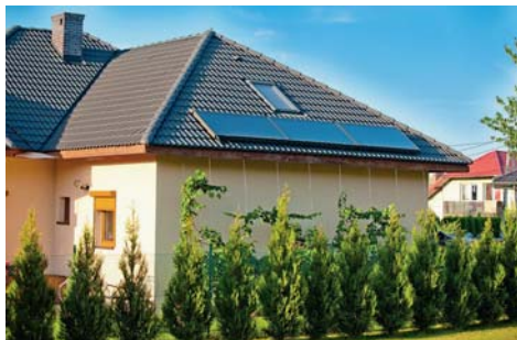
Rys. 1. Kolektory płaskie z absorberami harfowymi pozwalają na montaż w dowolnej pozycji

Dla polskich warunków klimatycznych, a także ze względów ekonomicznych, dla większości sytuacji inwestycyjnych konieczna jest całoroczna praca instalacji solarnej. W ten sposób można dążyć do uzyskania krótkich okresów zwrotu kosztów inwestycji, które będą tym krótsze im: