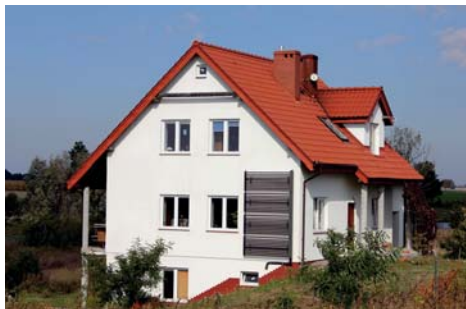
Rys. 3. Kolektory próżniowe Hewalex KSR10 pozwalają na montaż także na elewacji budynku w pozycji pionowej

wynosi od kilku do maksymalnie 10%, podczas, gdy w Polsce ponad... 26% (dane estif.org). Wynika to w znacznej mierze z braku powszechnej świadomości różnic pomiędzy kolektorami próżniowymi, wśród których znajdują się zarówno wysokosprawne urządzenia, jak i niskobudżetowe o przeciętnych osiągnięciach – często niższych w porównaniu do kolektorów płaskich.