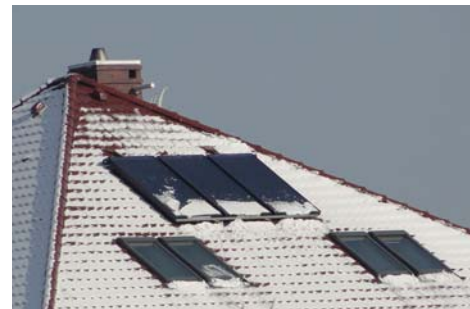
Rys. 5. Kolektory płaskie z warunkach zimowych uzyskują szybką gotowość do pracy, samoczynnie usuwając śnieg i szron z powierzchni szyby

Kolektory próżniowe nawet przy atrakcyjnej cenie będą droższe w zakupie od kolek-