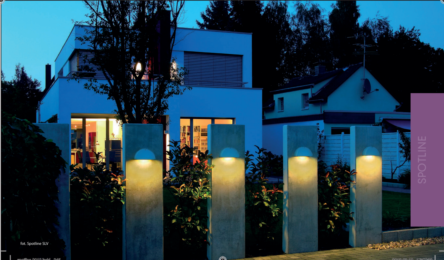
fol. Spotline SLV