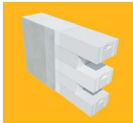
Przykład – przekrój muru: YTONG gr. 36, 5 cm

ściany jednowarstwowej, inwestor zabezpiecza się przed zmianami cen materiałów budowlanych (np. wzrostem cen izolacji termicznej). Bloczki YTONG, charakteryzują się najlepszymi parametrami cieplnymi spośród wszystkich materiałów ściennych, przez co świetnie nadają się do budowania w technologii ścian jednowarstwowych. Ściana jednowarstwowa zewnętrzna z bloczków YTONG gwarantuje komfort cieplny przyszłym mieszkańcom.