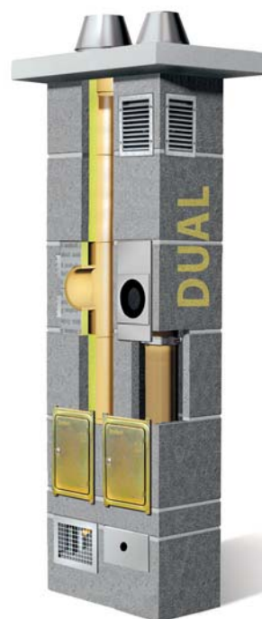
System kominowy Dual