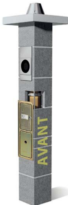
System kominowy Avant