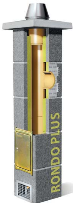
System kominowy Rondo Plus