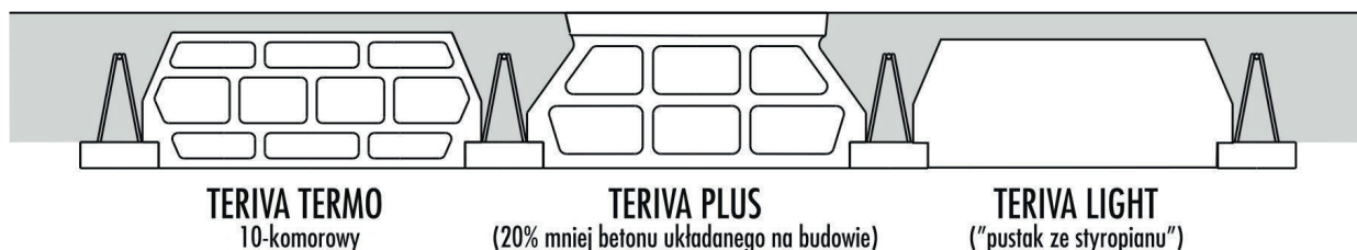
TERIVA TERMO 10-komorowy