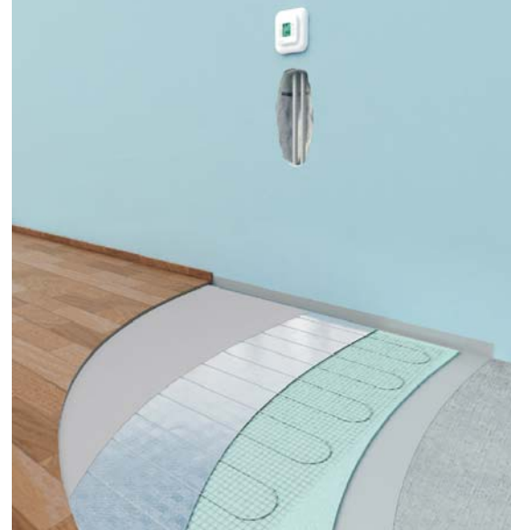
Ogrzewanie podłogowe ELEKTRA WoodTec™ z przykładowym umiejscowieniem ściennego regulatora temperatury

Regulator umieszczamy w miejscu nie nasłonecznionym, na wysokości umożliwiającej