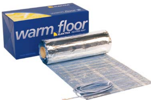
Maty jednostronnie zasilane WoodTec 2 ™

Układa się je na sucho, bezpośrednio pod panelami lub deską warstwową. W porównaniu