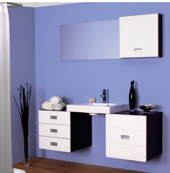
fol. Elita Meble