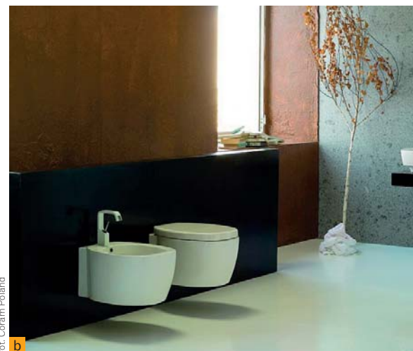
fol. Coram Poland b

▲ Bidet i wc mogą być stojące – mocowane do podłogi (a) lub podwieszane (b). Przybory wiszące są bardzo praktyczne, bo ułatwiają mycie podłogi, ale trzeba za nie więcej zapłacić