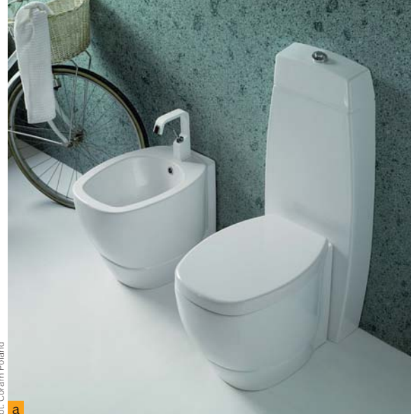
fol. Coram Poland a

Współczesne urządzenia sanitarne produkuje się nie tylko z ceramiki. Umywalki i brodziki, a także inne sprzęty wykonu-