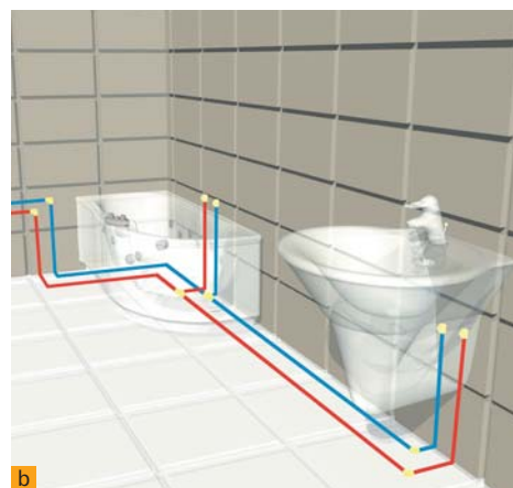
Instalację wodociągową w łazience można wykonać na dwa sposoby: w układzie rozdzielaczowym (a), w układzie trójnikowym (b)