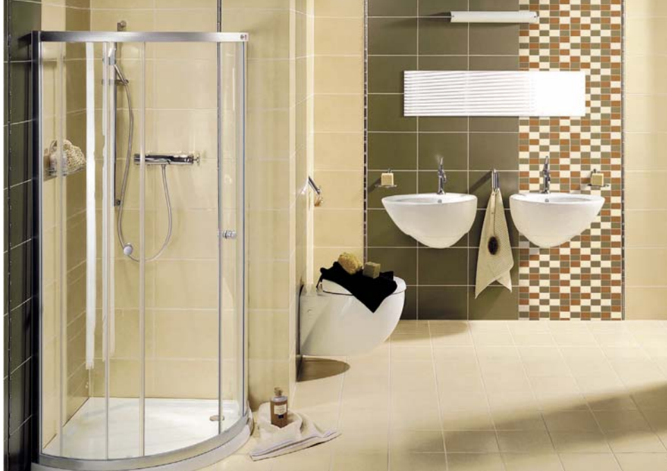
fol. Ceramika Korńskie

▲ Najpopularniejszym materiałem na ściany i podłogi w łazience są płytki ceramiczne różnej wielkości