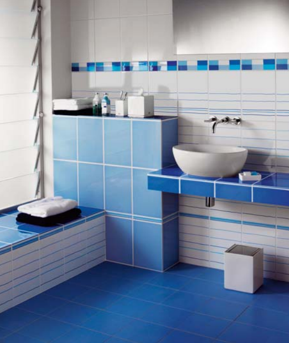
fol. Villeroy & Boch