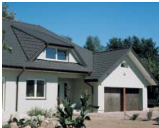
Blachodachówkami można pokrywać nawet dachy o skomplikowanych kształtach

Jest to pokrycie lekkie i należy do najtańszych (biorąc pod uwagę koszt tylko samej papy lub gontu, nie wliczając kosztów poszycia). Trwałość pokrycia z gontów określana jest na ok. 30 lat. Pasy dachówek są giętkie i elastyczne, co ułatwia prace dekarские. Dachówki bitumiczne są nienasiąkliwe i odporne na działanie szkodliwych czynników atmosferycznych. Największym wrogiem bitumicznych pokryć dachowych jest promieniowanie UV. Aby uchronić warstwę bitumiczną producenci stosują różnej grubości po-