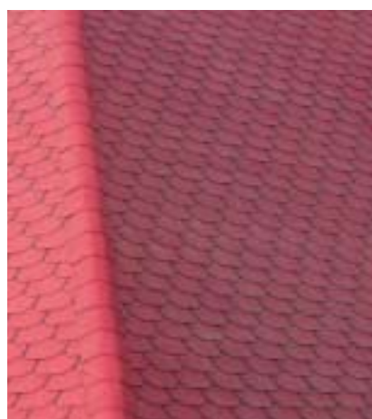
O wyglądzie dachu pokrytego gontami bitumicznymi w dużej mierze decydują wycięcia dolnej krawędzi

Podniszczony dach (zazwyczaj po upływie kilkudziesięciu lat) można pomalować farbą zalecaną przez producenta blachodachówek. Nie maluje się jednak pokryć z posypką mineralną.