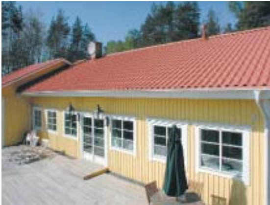
Duże arkusze blachodachówki są łatwe w układaniu

przeszkolonej i doświadczonej w układaniu tego typu pokryć. Jej usługi mogą okazać się droższe i podwyższyć koszt pokrycia dachu (biorąc pod uwagę cenę samego gontu).