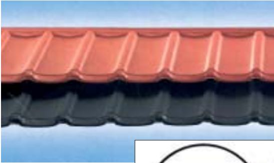
Blachodachówka samonośna; widoczny stalowy profil – odpowiednik łąty