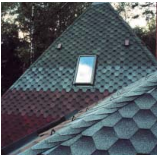
Dachówki bitumiczne mogą być cieniowane, dzięki czemu dach wygląda oryginalnie

Wykonanie pokrycia można zlecić ekipie dekarzkiej, ale można też wiele zaoszczędzić na kosztach jego ułożenia. Jest to bowiem tak proste i łatwe, że może się tego podjąć każdy doświadczony majsterkowicz. Niepotrzebne są też specjalistyczne narzędzia. Producenci, przewidując taką możliwość, dołączają do sprzedawanych dachówek szczegółową instrukcję przygotowania podłoża i montażu pokrycia. Wystarczy przestrzegać zawartych w niej zaleceń, aby samemu wykonać szczelne i trwałe pokrycie.