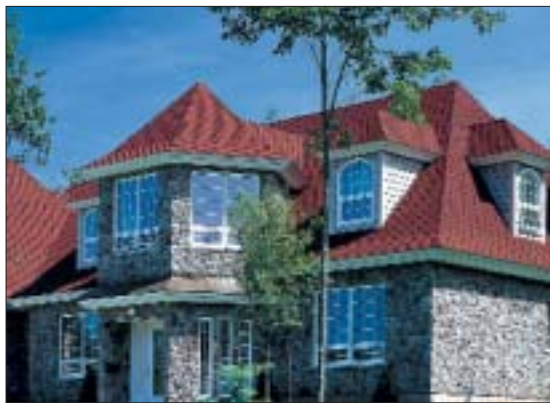
Wiele dachówek bitumicznych imituje ceramikę

syпки mineralne. Dobrze tłumią one dźwięk kropli deszczu uderzających o dach.