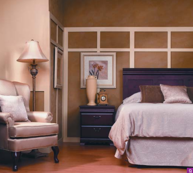
9 10