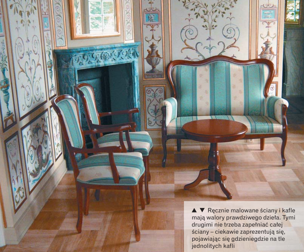
▲ ▼ Ręcznie malowane ściany i kafle mają walory prawdziwego dzieła. Tymi drugimi nie trzeba zapędniać całej ściany – ciekawie zaprezentują się, pojawiając się gdzieś na tle jednolitych kafli