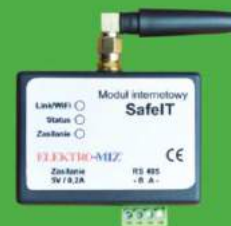
Moduł Safe IT