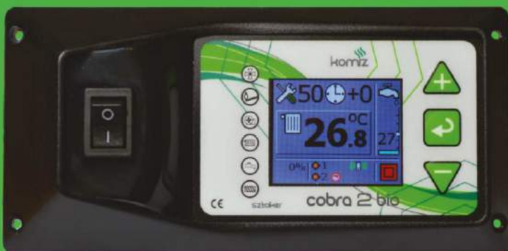
Cobra 2 BIO

Sterownik COBRA 2 BIO z algorytmem PID II włącza kocioł na taką moc jaka jest w danym momencie potrzebna do utrzymania zadanej temperatury.