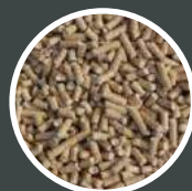
PALIWO PODSTAWOWE: PELET DRZEWNY