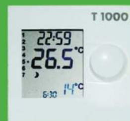
Panel zdalny T1000