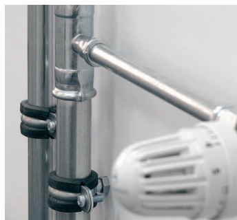
Instalacja Systemu KAN-therm Steel