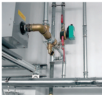
Instalacja Systemu KAN-therm Inox