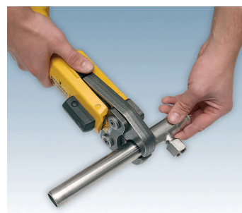
Steel/Inox – zaprasowanie kształtki na rurze