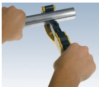
Steel/Inox – cięcie rury