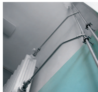
System KAN-therm Steel – modernizacja