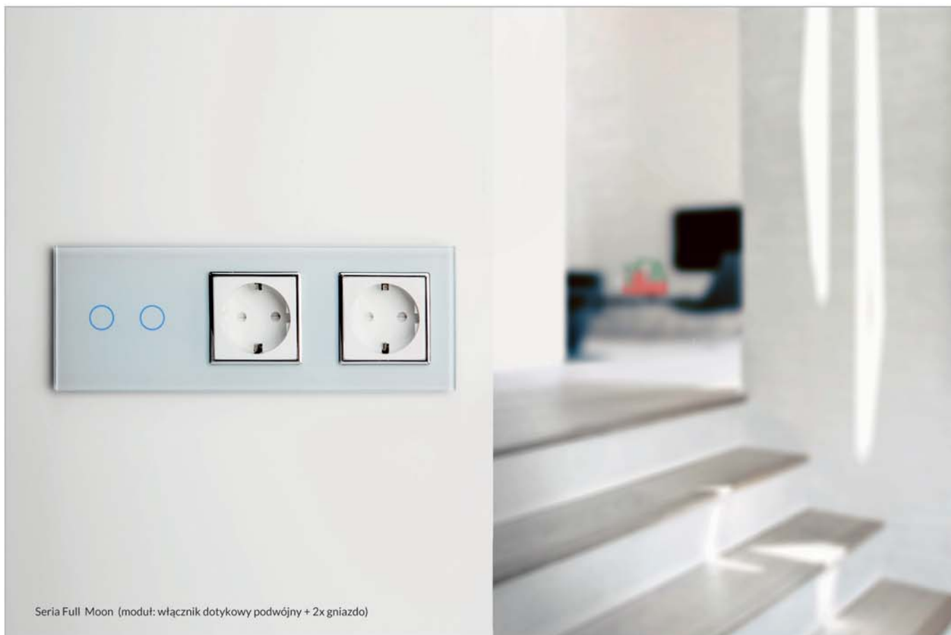
Seria Full Moon (moduł: włącznik dotykowy podwójny + 2x gniazdo)