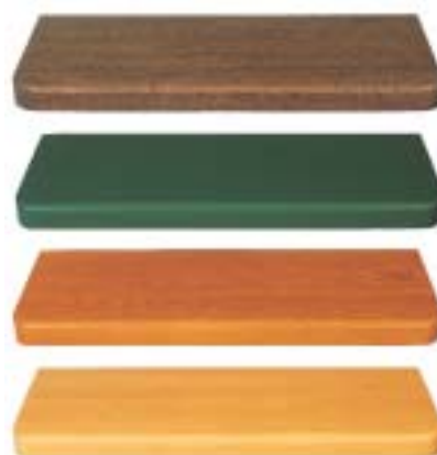
4 Parapety drewniane można malować na dowolny kolor

sycha, kurczy się i odkształca). Dzięki odpowiedniej obróbce drewna (struganie, szlifowanie, frezowanie i klejenie) otrzymuje się wyroby o bardzo dobrej jakości. Płyta parapetu drewnianego powinna być łączona na szerokości z desek na pióro i wpust, i klejona przy użyciu kleju odpornego na wilgoć, wodę oraz wysoką temperaturę. Jednak nawet drewno najlepszej jakości ma tendencję do odkształcania się, zwłaszcza w pomieszczeniach o zmiennej temperaturze i wilgotności. Dlatego spodnia powierzchnia płyty parapetu powinna być umieszczona co najmniej 15 cm nad grzejnikiem. Parapety drewniane można barwić bejcamy, lakierobejcami, lakierami itp. Wymiary parapetów drewnianych dostosowane są do typowych okien, ale można zamówić elementy o dowolnej wielkości, z różnych