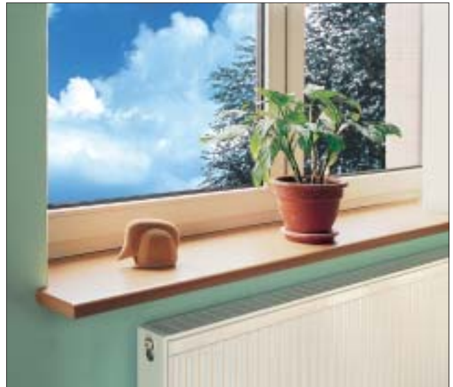
5 Parapety z postformingu imitują drewno

O wytrzymałości parapetu decyduje głównie materiał, z którego wykonany jest rdzeń, natomiast warstwa wykończeniowa stanowi powłokę ochronną i ma ostateczny wpływ na wygląd. Parapety nie są narażone na oddziaływanie dużych obciążeń, dlatego większe wymagania stawiane są powłokom ochronnym niż rdzeniowi. Powłokami ochronnymi są najczęściej folie PVC, laminaty (np. na bazie żywicy melaminowych lub akrylowych), kilkuwarstwowe powłoki lakiernicze.