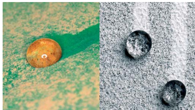
Kropla deszczu spływając po liściu lotosu zabiera ze sobą zanieczyszczenia

■ StoLotusan Color – elewacyjna farba z efektem lotosu o właściwościach „samoczyszczania”. Odzworowano w niej mikrostrukturę liścia lotosu, rośliny, o zawsze czystych i suchych liściach. Dzięki takiej strukturze zanieczyszczenia nie przywierają do powierzchni a jedynie spoczywają na niej. W czasie deszczu krople wody przetaczają się po silnie hydrofobowym podłożu i z łatwością zabierają zanieczyszczenia. W farbie StoLotusan Color powłokę tworzą ziarna mineralne o odpowiednim kształcie i mikroemulsja żywicy silikonowej. Zapewnia to najwyższą hydrofobowość powłoki przy wysokiej przepuszczalności pary wodnej.