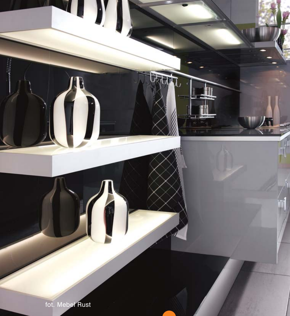
fol. Mebel Rust