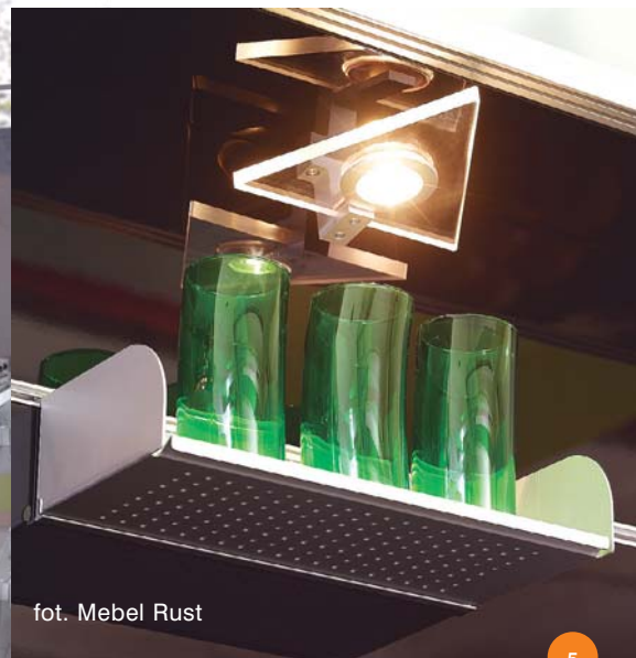
fol. Mebel Rust