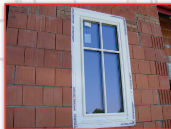
Taśma paroprzepuszczalna SWS OUTSIDE chroni warstwę pianki od zewnątrz