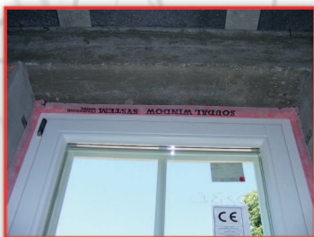
Taśmy paroszczelna SWS INSIDE chroni warstwę pianki od wewnątrz

Użycie paroizolacyjnych taśm okiennych to najskuteczniejsza metoda zabezpieczenia warstwy piany przed przenikaniem wilgoci z otoczenia. Tylko sucha warstwa piany posiada odpowiednie parametry izolacyjne.