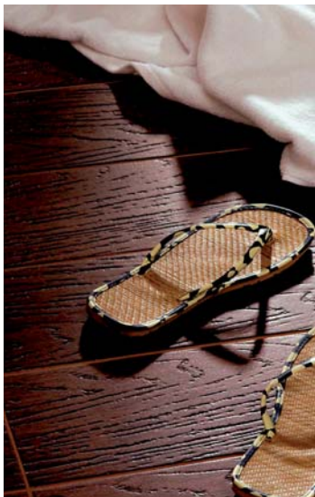
Płytki podłogowe powinny mieć fakturowaną powierzchnię, wówczas są antypoślizgowe

W mokrej strefie łazienki lepiej jednak, żeby była mniejsza niż 3%. I wreszcie twardość, określana liczbami od 1 do 10. W domu mieszkalnym wystarczy wartość 5–6.