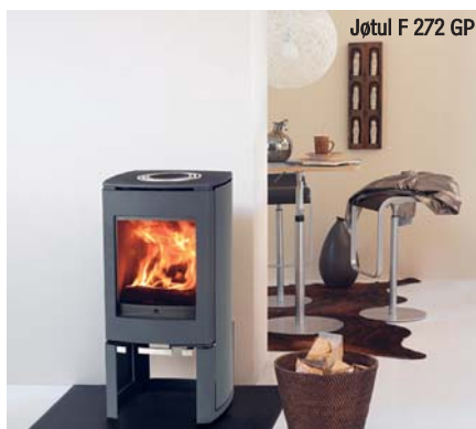
Jøtul F 272 GP

Posiadaczom dużych salonów polecamy piece Jøtul F 500 i Jøtul F 600. Wykonane w tak zwanym stylu kolonialnym piece znakomicie pasują do tradycyjnego wystroju wnętrz. Ich moc nominalna 11 i 12 kW pozwala ogrzać do 150 m 2 .