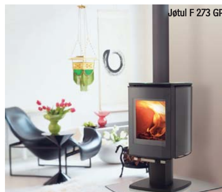
Jøtul F 273 GP