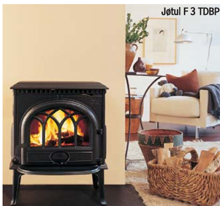
Jøtul F 3 TDBP