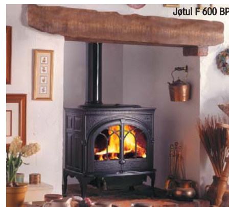
Jøtul F 600 BP

Zwolennicy nowoczesnych form zainteresują się linią pieców Jøtul F 270. Korzystając z jednej komory spalania, kilku rodzajów nóg oraz stalowych, steatytowych lub szklanych płyt ozdobnych, każdy może zaprojektować swój piec.