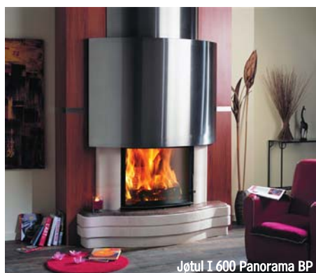
Jøtul I 600 Panorama BP

SCAN FORUM Sp. z o.o. ul. Twarda 12A 80-871 Gdańsk tel. 058 340 38 88 www.jotul.pl www.troll.net.pl e-mail: scanforum@jotul.pl