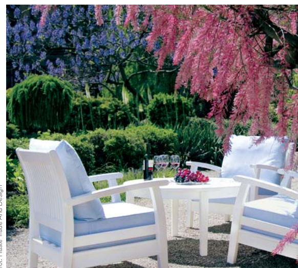
fol. Haste Trade And Design

Usytuowanie w ogrodzie poszczególnych obiektów nie może być przypadkowe. Jedne