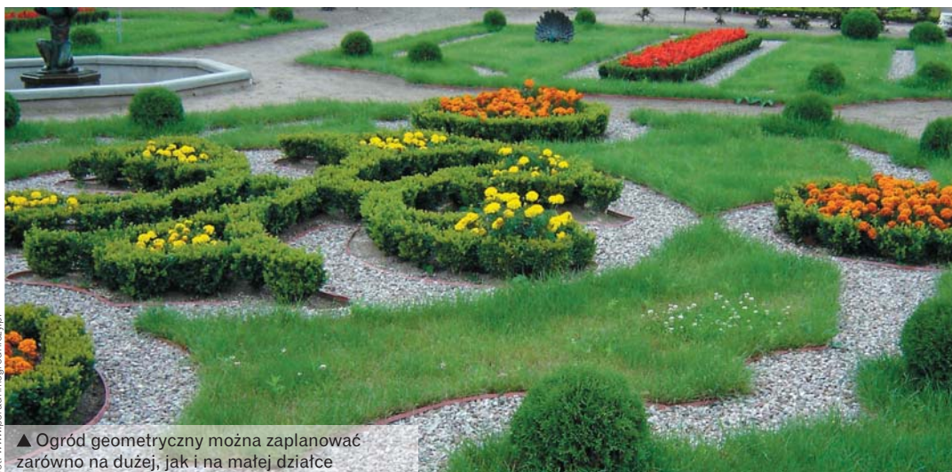
▲ Ogród geometryczny można zaplanować zarówno na dużej, jak i na małej działce

Ogród nieregularny (swobodny) – układ ogrodu stwarza wrażenie przypadkowości i płynnie łączy się z otaczającym krajobrazem. Taki układ dobrze wpisuje się w działki o urozmaiconej rzeźbie terenu i nieregularnym zarysie granic (na małej, regularnej działce miejskiej granice ogrodu swobodnego dobrze jest zamaskować wysoką roślin-