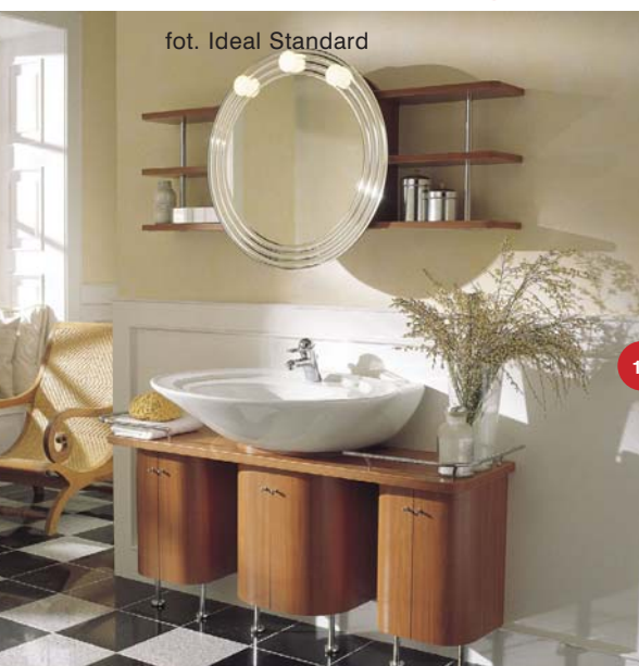
14 fot. Ideal Standard