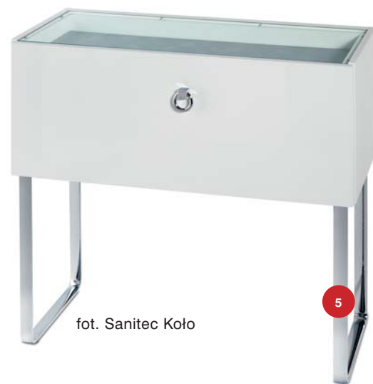
fol. Sanitec Koło

Minimalizm industrialny, to zwykle beton i żywiczna posadzka. Tu najlepiej poczuć się połyskliwe sprzęty ze stali oraz szkło. Z tego ostatniego powstaje dziś coraz więcej elementów: szafki i blaty podumywalkowe, stoliki i witryny, jest bowiem praktyczne – twarde i odporne na zarysowania, a jego plastyczność pozwala na kształtowanie wyjątkowych, niepowtarzalnych form. Meble ze szkła transparentnego są