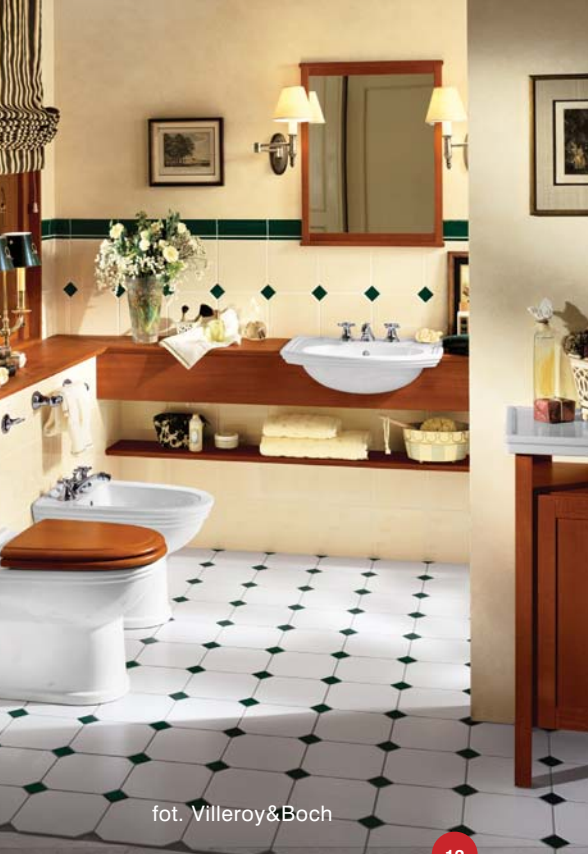
12 fot. Villeroy&Boch