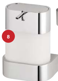
fol. Ideal Standard