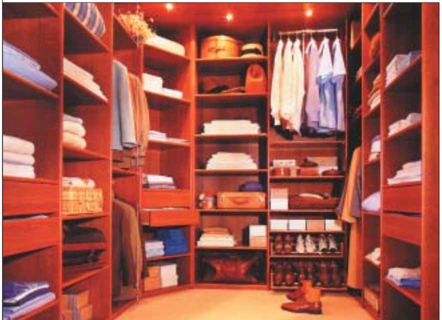
3 Rozmaitość szuflad i półek pozwala zabudować każdą przestrzeń