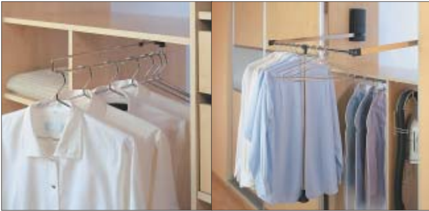
4 Wysuwane i opuszczane wieszaki pomagają w przeglądaniu zawartości szaf

wać relingowy uchwyt), umieszczone pod odpowiednim kątem metalowe drążki stanowiące podporę dla buta lub ażurowe półki, które umożliwiają swobodny dostęp do butów oraz obieg powietrza.