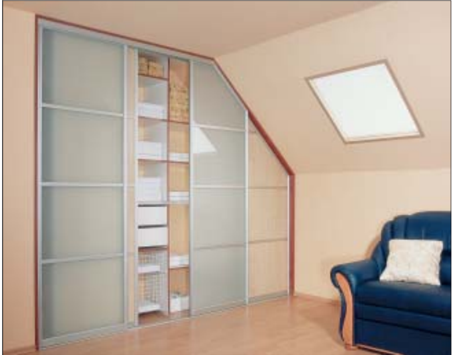
2 Nawet na poddaszu możemy zrobić wygodną garderobę

W dzisiejszych czasach garderoba często to nie tylko pomieszczenie, w którym przechowujemy ubrania, niejednokrotnie pełni ona po części rolę pomieszczenia gospodarczego, w którym musi się znaleźć miejsce zarówno na deskę do prasowania, żelazko, odkurzacz, jaki i inne przedmioty związane z domem. W zależności od rozmiarów garderoby dobrze jest wygospodarować odpowiednią przestrzeń właśnie na tego typu przedmioty, na które zazwyczaj w domu po prostu brak miejsca. Z przedmiotami gospodarczymi jest najwięcej kłopotów, bo chcielibyśmy je mieć pod ręką, ale jednocześnie w miejscu niedostępnym dla oczu odwiedzających nas znajomych. Zamknięcie ich za drzwiami przesuwными jest więc rozwiązaniem idealnym.