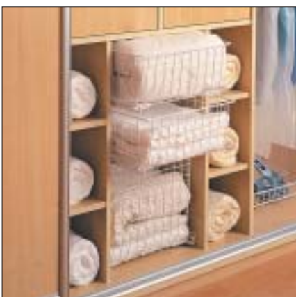
5 Druciane kosze ułatwiają przeglądanie rzeczy

w odpowiednim stopniu – np. regały w narożnikach lub głębiej położone półki. Wtedy konieczne jest światło sztuczne. Najlepszym rozwiązaniem jest osobne oświetlenie, niezależne od pomieszczenia, do którego przylega garderoba. Doskonale sprawdzają się lampki halogenowe umieszczone pod sufitem i w górnych częściach ścian. Dają one światło jednako rozproszone w całym pomieszczeniu. Innym rozwiązaniem są lampki halogenowe z możliwością regulacji kąta padania światła oraz kinkiety naścienne, które dają światło w konkretnych miejscach garderoby. Bardzo często stosuje się też lampki halogenowe lub listwy oświetleniowe umieszczane bezpośrednio w wystającym cokole, zwanym wieńcem górnym mebla, w ten sposób uzyskujemy jasny strumień światła w konkretnym module 7 .