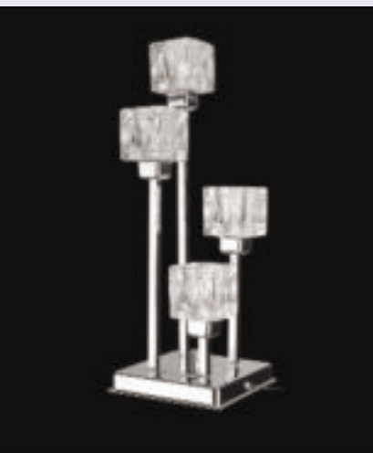
14 Lampa stojąca Kostka

nia wzornicza 15. Tworzą ją wyroby o szczególnie dekoracyjnych kształtach, miękkich liniach i często bogato zdobione. Niektóre z nich mają fantazyjnie pofalowane lub przypominające kielichy kwiatów klosze. Pojawiają się też na nich różne motywy dekoracyjne –