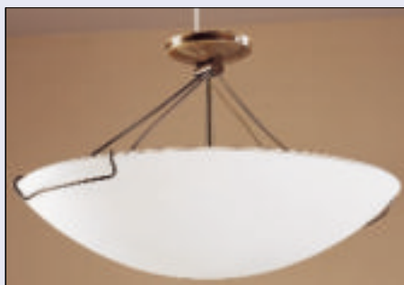
12 Lampa sufitowa Prisma bis

niem. Pierwsze elektryczne lampy wykonane techniką witrażu pojawiły się już w okresie secesji, a ich twórcą był Louis C. Tiffany. Komponował on wielobarwne klosze, łącząc ręcznie kawałki szkła taśmą miedzianą i następnie cynowaną. Całości zaś dopełniały rzeźbione podstawy z brązu. Kolorowe klosze, tworząc barwne refleksy świetlne, wprowadzają intymny, sprzyjający wypoczynkowi nastrój 10. Obecnie jednak nie wszystkie dostępne na rynku lampy witrażowe wytwarzane są według dawnych reguł.