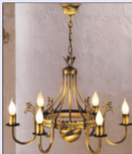
17 Lampa wisząca Korona

Dane teleadresowe wiodących producentów oraz orientacyjne ceny wybranych produktów przedstawiamy w rubryce Info rynek .