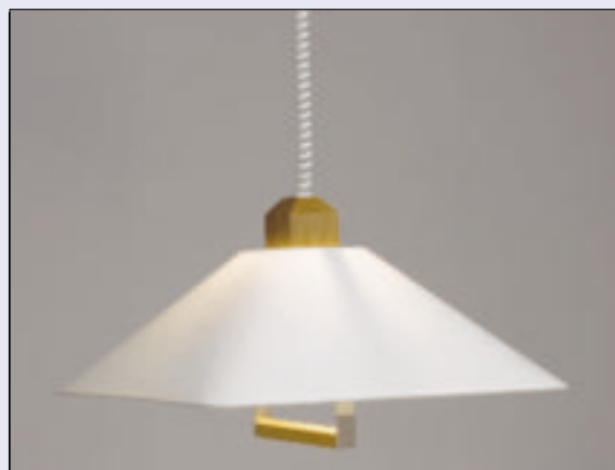
7 Lampa wisząca Ekuren

Wygodnym i praktycznym rozwiązaniem stosowanym w lampach stojących jest tzw. łamana konstrukcja. Umożliwia to dowolne ustawianie kłosa, na przykład w stronę fotela, aby lepiej oświetlić strony czytanej książki.