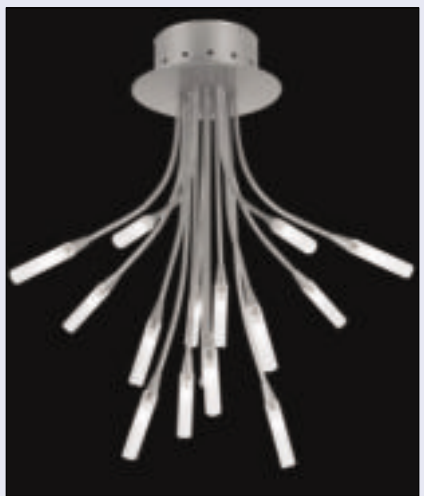
11 Lampy wisząca i stołowa (obok) z rodziny o nazwie Trzcina

Do grupy tej można także zaliczyć lampy witrażowe, które od wielu dziesiątków lat cieszą się niesłabnącym powodze-