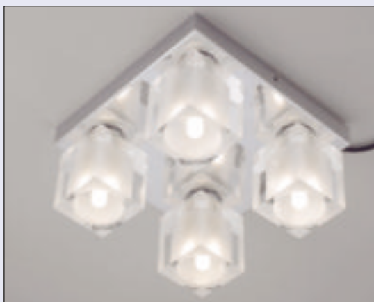
4 Lampa sufitowa Amarant

zjawisko olśnienia (nadmiernie jaskrawe światło, powodujące dyskomfort). Ponadto musi być wyposażona w przewody niezbędne do podłączenia do instalacji elektrycznej oraz w elementy służące do mocowania lampy do ściany lub sufitu. Lampy muszą być wykonane z materiałów, które pod wpływem ciepła nie będą się odkształcały.