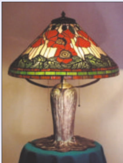
10 Kopia lampy witrażowej Maki, zaprojektowanej przez Tiffany'ego

Spośród niezliczonej ilości form lamp, można wydzielić ich trzy grupy. Pierwsza z nich to lampy klasyczne 17. Są to lampy stylowe, pasujące do zabytkowych mebli i tkanin dekoracyjnych, wykonanych według wzorów pochodzących z różnych epok historycznych. Wybór jest ogromny: od kucych metalowych pająków i kinkietów,