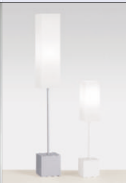
3 Lampy stojące Style (fol. Targetti)