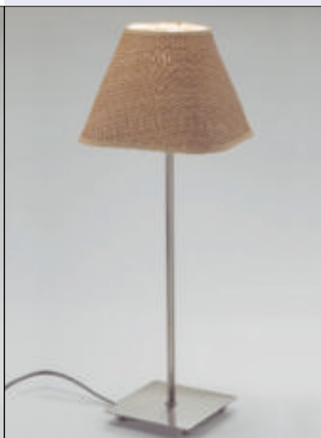
2 Lampa stołowa Jillan (fol. Markslojd)