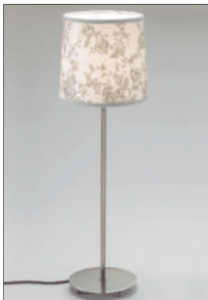
1 Lampa stołowa Bullanti (fol. Markslojd)

Przy zakupie lampy najczęściej kierujemy się jej wyglądem. Tymczasem musi ona przede wszystkim spełniać swoją podstawową funkcję – właściwie oświetlać pomieszczenie lub jego wybrane fragmenty. Lampa to dekoracyjna oprawa dla jednego lub kilku źródeł światła (żarówek tradycyjnych, halogenowych czy świetlówek), zapewniająca odpowiednie natężenie i ukierunkowanie strumienia świetlnego. Dlatego też ważne są jej parametry techniczne. Powinna również zapewniać przyjemne dla oczu światło i likwidować