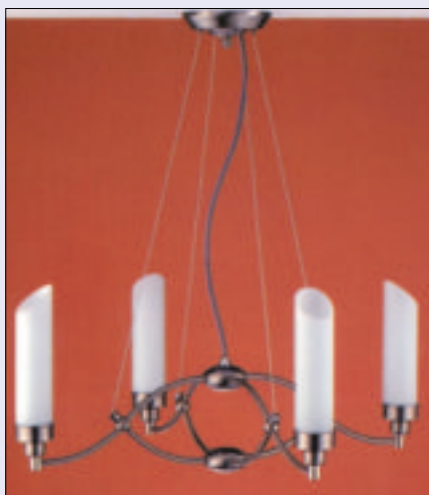
15 Lampa sufitowa Bryza

od prostych, geometrycznych do bardziej finezyjnych. Konstrukcje tych lamp najczęściej wykonane są z giętych prętów metalowych – ozdobnie wyginanych czy też przypominających łodygi roślin.