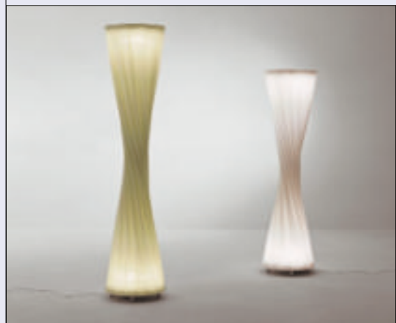
9 Lampy stołowe Valzer