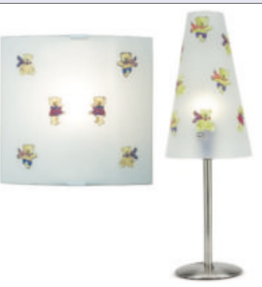
13 Lampy Teddy do pokoju dziecięcego

Na tle ogromnej oferty lamp wyróżnia się jeszcze jedna, równie liczna, li-