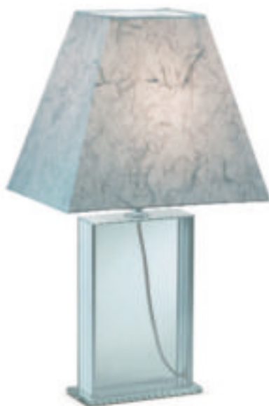
6 Lampa stołowa Sarek

Kolejna grupa to lampy ściennie , czyli różnego rodzaju kinkiety 5 . Zwykle montuje się je w miejscach, które chcemy dodatkowo doświetlić. Można też, dzięki odpowiedniemu nakierowaniu ich strumienia światła, zaakcentować wybrane fragmenty wnętrza, obrazy czy przedmioty dekoracyjne. W łazienkach mogą być jedynym źródłem światła.