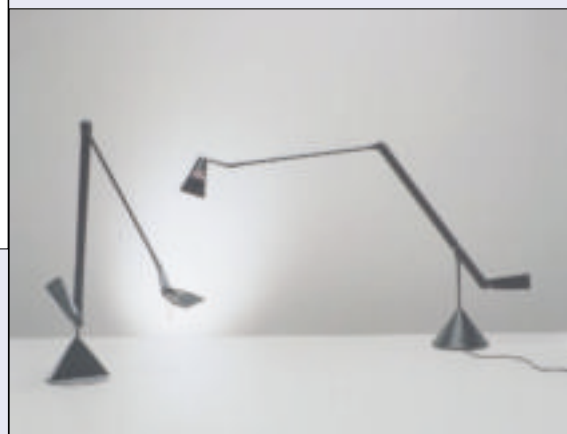
8 Lampy biurkowe Zelig

Są też lampy kierujące strumień światła na przykład w dwie różne strony – na sufit i stojący obok fotel. W jeszcze innych modelach jedna żarówka umieszczona jest na górze lampy, a druga na wysokości fotela. W rzeczywistości mamy więc dwie lampy na wspólnej podstawie 16 .