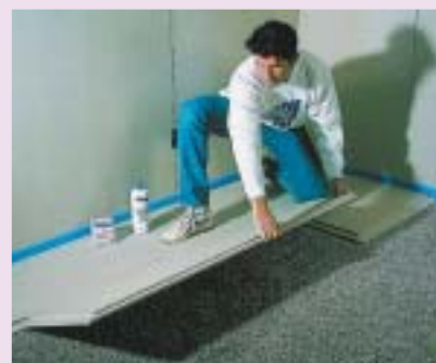
9 Układanie elementów suchego jastrychu

Wykończenie powierzchni 10 zwykle polega na zagruntowaniu całej powierzchni jastrychu, szczególnie gdy przewidziana jest posadzka z paneli podłogowych czy mozaiki drewnianej. Pozwala to na związanie znajdującego się na powierzchni pyłu oraz silniejsze połączenie posadzki z podkładem. Natomiast w przypadku cienkich wykładzin dywanowych lub z PVC konieczne jest jeszcze dodatkowe zaszpachlowanie całej powierzchni. Podobnie jak wtedy, gdy po podłodze ma się poruszać wózek inwalidzki czy krzeselko na kółkach, z tym, że grubość warstwy nie powinna być mniejsza niż 2 mm.