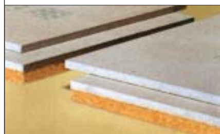
3 Płyty gipsowo-włóknowe z warstwą wełny mineralnej

spolone z warstwą izolacji akustycznej lub termicznej ze styropianu grubości 2-6 cm, miękkiej płyty pilśniowej bądź wełny mineralnej grubości 1 cm 3 . Płyty mają wyprofilowane krawędzie, umożliwiające połączenie na pióro i wpust lub zakład. Dzięki temu możliwe jest uzyskanie równej i gładkiej powierzchni posadzki. Typowe wymiary płyt to: szerokość 60 cm i długość 200-240 cm.