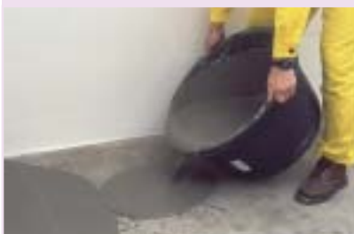
4 Układanie wylewki samopoziomującej

Przygotowanie podłoża to wstępna czynność, od której w dużym stopniu zależy ostateczny efekt, czyli równa i gładka powierzchnia jastrychu. Niewielkie nierówności betonowego podłoża (podłogi na gruncie lub stropu) nieprzekraczające 10 mm wyrównuje się płynną szpachlówką, tzw. wylewką samopoziomującą 4, 5 . Jest to rozwiązanie najłatwiejsze, najszybsze i najbardziej efektywne. Większe różnice poziomów (10-50 mm) zwykle wyrównuje się suchą podsypką 6 . Jej zaletą jest to, że nie wymaga zagęszczania, nie trzeba również czekać na wyschnięcie wylewki. Natomiast przy układaniu nowej podłogi na deskach należy wcześniej położyć papier pakowy lub bitumowany, ewentualnie folię budowlaną w celu uszczelnienia podłoża. Na starych, ale równych posadzkach, wystarczy ułożyć tekturę falistą lub cienką warstwę pianki polietylenowej (grubości do 5 mm).