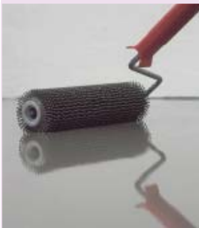
5 Odpowietrzanie wylewki samopoziomującej