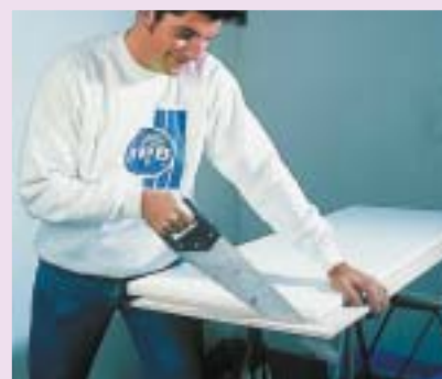
8 Obcinanie wypustu (felcu) w płytach mających znaleźć się przy ścianie

Układanie płyt 8, 9 można rozpocząć od drzwi lub lewego narożnika pomieszczenia - wymuszają to wyprofilowane krawędzie elementów. Płyty układa się w sposób ciągły, co oznacza, że resztką z jednego rzędu stanowi początek następnego. Dzięki temu ogranicza się ilość odpadów, a także łatwo jest przesunąć fugi przynajmniej o 25 cm (nie mogą się krzyżować). Połączenia na pióro i wpust lub na zakład należy skleić oraz docisnąć. Czasami dodatkowo łączy się je systemowymi wkrętami. Nadmiar kleju służy do szpachlowania fug, które i tak powinny się w ten sposób wzmocnić oraz uszczelnić.