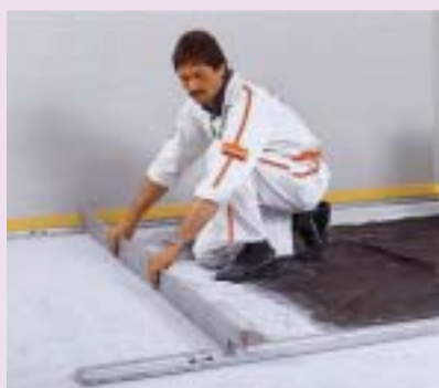
6 Układanie suchej podsypki pod płyty jastrychu (fot. Fels Werke Xella)

Dylatacje 7 . Wykonuje się je w ten sposób, że do ścian oraz rur przechodzących przez strop przykleja się tzw. taśmę brzegową, czyli pas pianki polietylenowej grubości 1-2 cm i szerokości 5-15 cm (wymiary zależą od całkowitej grubości warstw podłogowych). Piankę można zastąpić każdym materiałem elastycznym, np. styropianem, wełną mineralną, korkiem. Materiały te nie tylko niwelują boczne przenoszenie dźwięków, ale też umożliwiają swobodne rozszerzanie się i kurczenie jastrychu na skutek zmiennej wilgotności i temperatury otoczenia.