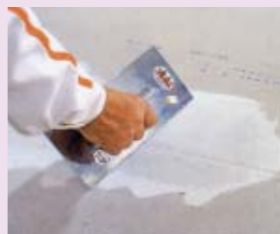
10 Szpachlowanie spoin pomiędzy płytami suchego jastrychu

Wykończenie powierzchni 10 zwykle polega na zagruntowaniu całej powierzchni jastrychu, szczególnie gdy przewidziana jest posadzka z paneli podłogowych czy mozaiki drewnianej. Pozwala to na związanie znajdującego się na powierzchni pyłu oraz silniejsze połączenie posadzki z podkładem. Natomiast w przypadku cienkich wykładzin dywanowych lub z PVC konieczne jest jeszcze dodatkowe zaszpachlowanie całej powierzchni. Podobnie jak wtedy, gdy po podłodze ma się poruszać wózek inwalidzki czy krzeselko na kółkach, z tym, że grubość warstwy nie powinna być mniejsza niż 2 mm.