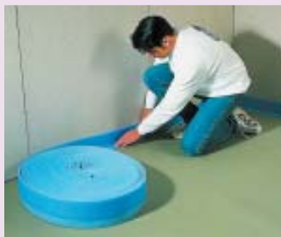
7 Układanie taśmy brzegowej na całym obwodzie ścian wewnętrznych

Dylatacje 7 . Wykonuje się je w ten sposób, że do ścian oraz rur przechodzących przez strop przykleja się tzw. taśmę brzegową, czyli pas pianki polietylenowej grubości 1-2 cm i szerokości 5-15 cm (wymiary zależą od całkowitej grubości warstw podłogowych). Piankę można zastąpić każdym materiałem elastycznym, np. styropianem, wełną mineralną, korkiem. Materiały te nie tylko niwelują boczne przenoszenie dźwięków, ale też umożliwiają swobodne rozszerzanie się i kurczenie jastrychu na skutek zmiennej wilgotności i temperatury otoczenia.