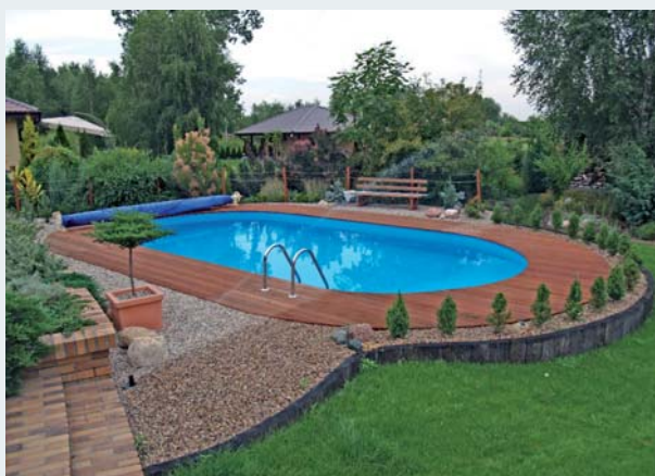
Niecka basenu może być wykończona folią z PVC, płytkami ceramicznymi lub mozaiką szklaną