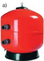
fol. Astral Pool

W basenach stosuje się filtry mechaniczne z materiałów porowatych (piaskowe, żwirowe, żwirowo-antracytowe), które zatrzymują osady i zanieczyszczenia. W małych basenach domowych stosuje się też wymienne wkłady filtracyjne: z siatki stalowej, poliestrowej, polietylenowej (trzeba je często wymieniać), oraz chemiczne środki dezynfekujące, korygujące odczyn pH i zapobiegające rozwojowi glonów. W basenach wodę dezynfekuje się chlorem, chlorem i ozonem, chlorem i promieniami UV lub bezchlorowo (promieniami UV, ozonem, bromem, jodem, tlenem aktywnym, jonizowaniem). Dozowanie środków może być ręczne lub automatyczne. Preparaty mają postać granulatu przeznaczonego do rozpuszczenia w wodzie lub płynu.