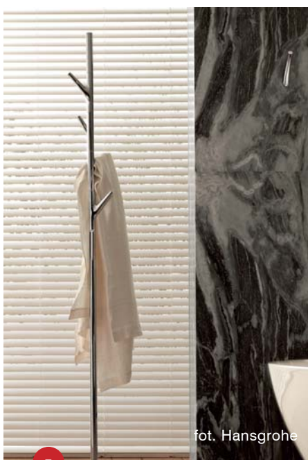
7 fot. Hansgrohe