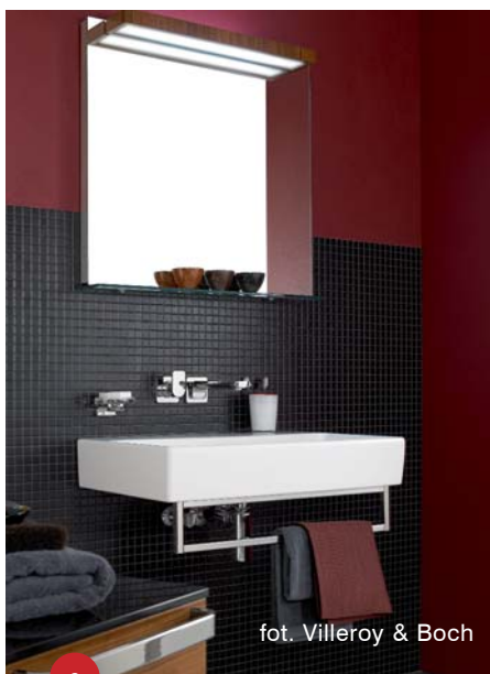
6 fot. Villeroy & Boch