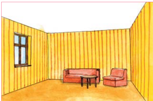
◀ ▶ Pionowe pasy na ścianach optycznie podwyższają pokój, a poziome – obniżają.