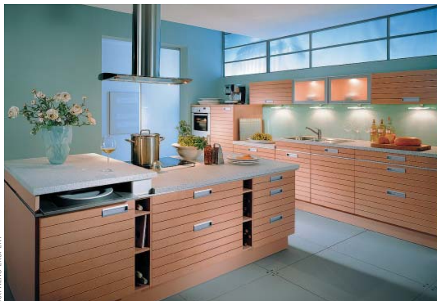
fol. ALNO EKSPERT