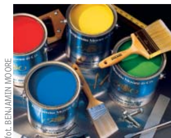
fol. BENJAMIN MOORE