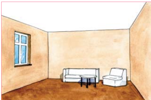
◀ ▶ Jasny sufit podwyższa, a ciemny obniża pokój.