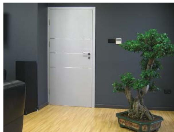
fol. DEWRO WRÓBEL

▼ Ciemne ściany zmniejszają pomieszczenie