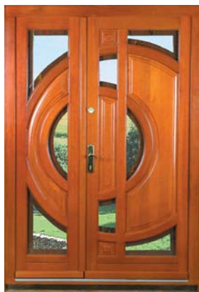
DRZWI ZEWNĘTRZNE ANTYWŁAMANIOWE – MODEL MILEWSKI II