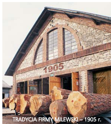
TRADYCJA FIRMY MILEWSKI – 1905 r.