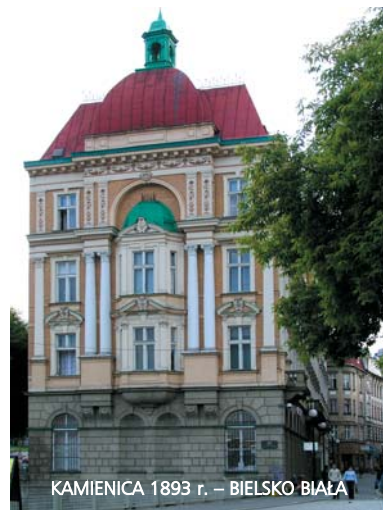
KAMIENICA 1893 r. – BIELSKO BIAŁA

Nasze atuty to trwałość i estetyka produkowanej stolarki otworowej.