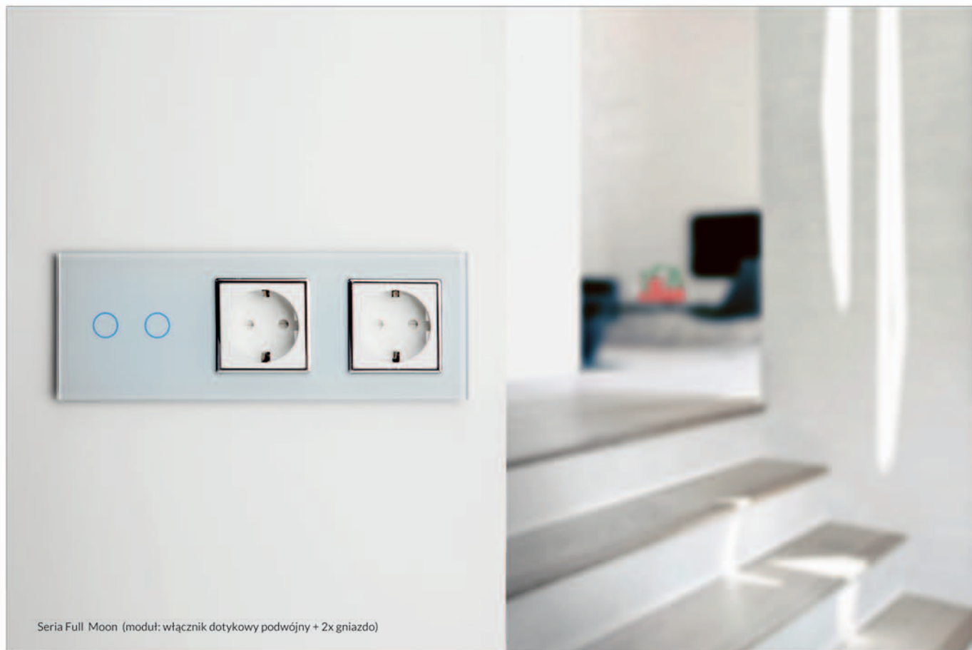
Seria Full Moon (moduł: włącznik dotykowy podwójny + 2x gniazdo)