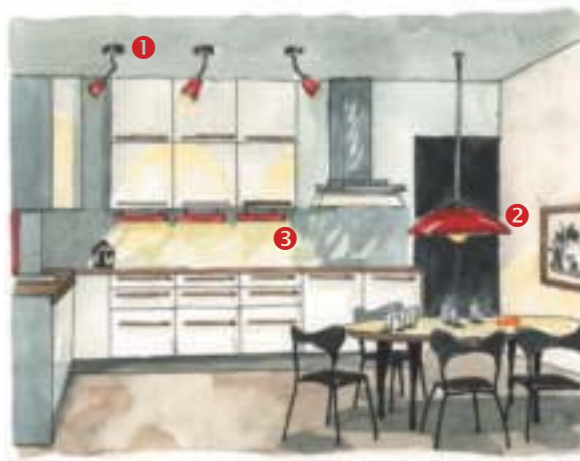
▶ Kuchnia: 1 – reflektorki halogenowe oświetlające wiszące szafki, 2 – lampa wisząca nad stołem, 3 – świetlówki oświetlające blat roboczy.