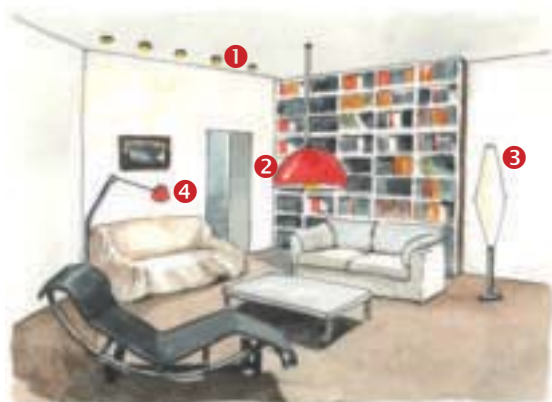
◀ Pokój dzienny: 1 – listwa z halogenami do oświetlenia ogólnego, 2 – lampa wisząca oświetlająca mały stolik, 3 – lampa stojąca, 4 – lampa stojąca z regulowanym kątem nachylenia.