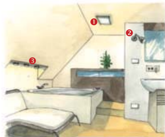
◀ Łazienka: 1 – oświetlenie ogólne (plafoniera), 2 – reflektorek halogenowy oświetlający lustro, 3 – listwa z halogenami nad wanną.