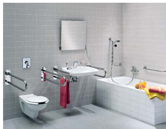
5 To jest łazienka bez barier – komfortowa dla niepełnosprawnych i do użytkowania przez pozostałych domowników (lustro jest uchylne, a poręcze składane) ▼

Nie jest łatwo urządzić łazienkę dla osoby niepełnosprawnej, ale jest to niestety w porównaniu z trudem, z jakim pokonuje ona codzienne czynności. We własnym domu każdy ma prawo do komfortu 5. ■