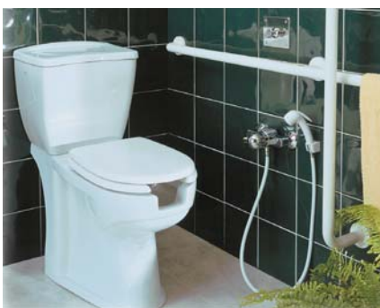
4 Sedes ze specjalnym otworem do higieny – bateria prysznicowa umożliwia korzystanie z tego urządzenia ▲

Często osoby niepełnosprawne mają delikatne zdrowie, co oznacza podatność na przeziębienia. A w chłodnej łazience po gorącej kąpeli o to nietrudno. Dlatego warto mieć „system” szybkiego jej docieplania. Najlepszym rozwiązaniem będą grzejniki: elektryczny lub wodno-elektryczny – wyposażony w grzałkę. Można je włączać nawet latem, gdy pojawi się taka potrzeba. Dla bezpieczeństwa być może trzeba będzie pomyśleć o osłonie chroniącej przed bezpośrednim kontaktem z ich zbyt gorącymi powierzchniami.