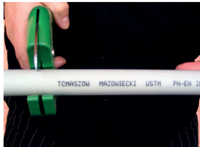
Cięcie rury Stabi FAST