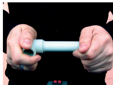
Zgrzewanie rury Stabi FAST