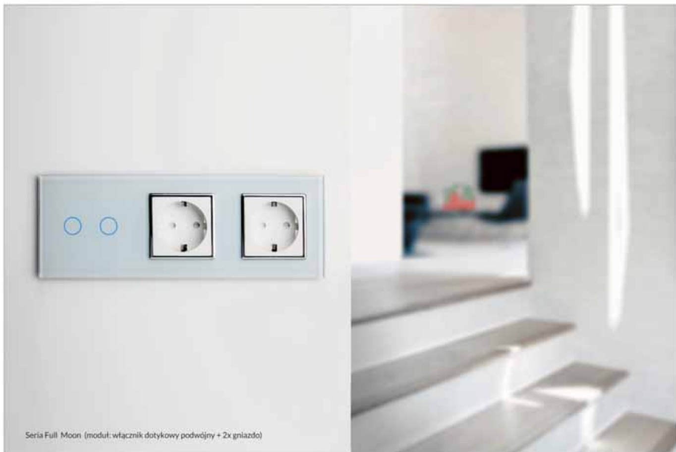
Seria Full Moon (moduł: włącznik dotykowy podwójny + 2x gniazdo)