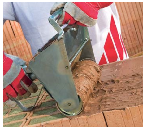
Szczegółowe instrukcje dotyczące murowania w systemie Porotherm Profi dostępne na www.wienerberger.pl

Zaprawę Porotherm Profi nanosi się cienką warstwą na warstwę cegieł szlifowanych, Porotherm T Profi za pomocą wałka. W tym celu w czystym naczyniu miesza się zaprawę z worka z wodą a następnie wypełnia się nią pojemnik zbiorczy wałka. W trakcie