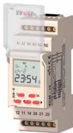
Programator czasowy ZCM-12