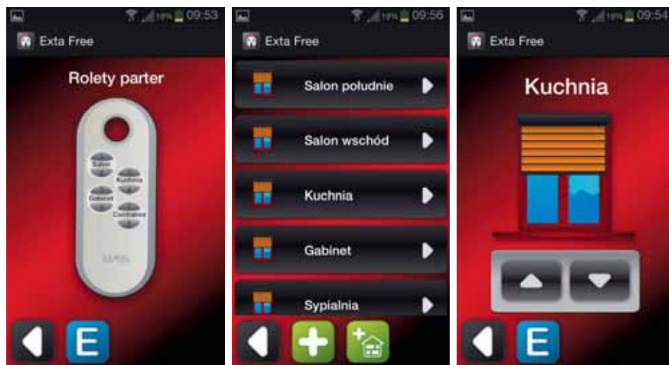
Sterowanie roletami poprzez aplikację EXTA FREE zainstalowaną na smartfonie

Sterownik linii centralnych SRP-03 pozwala na centralne, bezprzewodowe sterowanie grupą przewodowych sterowników rolet typu SRP-01. Urządzenie wysyła do linii sterowania centralnego impulsy sterujące. Jest to idealne rozwiązanie modyfikujące istniejące, przewodowe instalacje sterowania roletami.