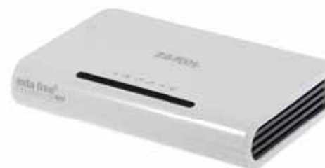
Jednostka centralna EFC-02