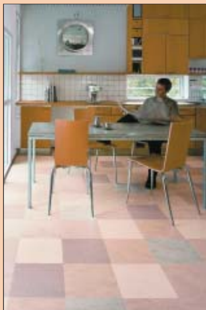
7 Linoleum jest produkowane z naturalnych surowców

Orientacyjne informacje o cenach poszczególnych materiałów i kosztach wykonania podłogi podajemy na str. 60