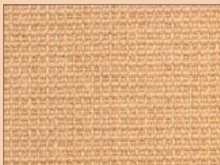
2 Wykładzina sizalowa ma wyraźny, efektowny splot

To całkowicie naturalny produkt otrzymywany z włókien agawy. Wykładzina sizalowa jest bardzo trwała, antystatyczna, nie ulega odkształceniom. Ma charakterystyczny, naturalny, surowy wygląd, który znakomicie komponuje się z modnymi ostatnio wnętrzami w stylu minimalistycznym 2 . Występuje w szerokiej gamie odcieni, wzorów i faktur. Nie jest odporna na wilgoć. Zamoczona może zmienić swój kształt i wymiary, dlatego nie nadaje się do takich pomieszczeń, jak kuchnia, jadalnia czy łazienka.