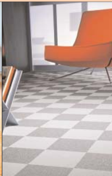
6 Obecnie wykładziny z PVC mają efektowne wzornictwo

Wykładziny elastyczne są trwałe, odporne na wilgoć i nawet najbardziej uciążliwe zabrudzenia. Sprawdzają się w pokojach dziecięcych oraz w mieszkaniach ze zwierzętami domowymi, gdzie podłoga narażona jest na uszkodzenie i wymaga częstszego odkurzania.