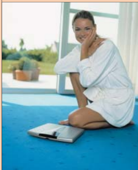
4 Wykładziny akrylowe wyglądem przypominają wełniane

Włókno syntetyczne przypominające wełnę 4 . Charakteryzuje się podobną miękkością oraz sprężystością co wełna, a jest zdecydowanie bardziej wytrzymałe. Ponadto jest odporne na działanie promieni słonecznych, trudnozapalne i nie elektryzuje się.