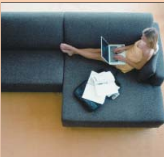
1 Wełna jest przyjemna w dotyku, a wykonana z niej wykładzina elastyczna

regulowania wilgotności w pomieszczeniu. Gromadzą jej nadmiar, który następnie oddają, gdy powietrze staje się przesuszone. Dzięki temu w pomieszczeniu zawsze mamy wrażenie świeżości.