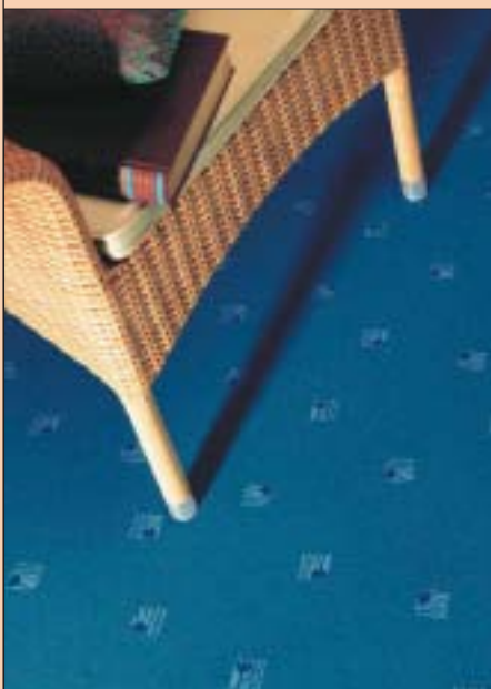
3 Odporny na zaplamienie i trwały polipropylen jest barwiony na intensywne kolory

Jest miękka, delikatna i przyjemna w dotyku, a przy tym ma interesujący i modny wygląd. To nowość na rynku wykładzin. Dobrze wygląda zarówno w tradycyjnych, jak i nowoczesnych wnętrzach. Jest idealnym rozwiązaniem do sypialni, ale sprawdza się także w pomieszczeniach intensywniej użytkowanych, gdyż jest trwała, odporna na ścieranie i nie mechaci się. Jest bardzo praktyczna i łatwa do utrzymania w czystości.